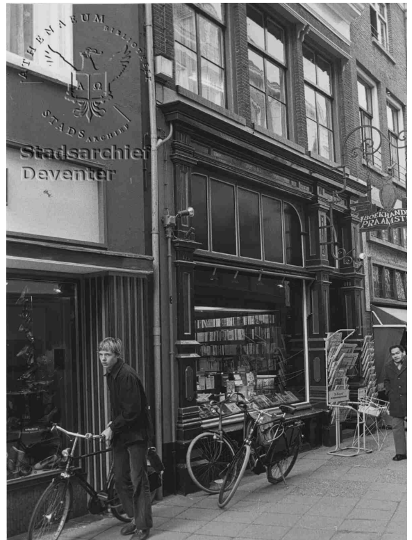
Foto uit archief Atheneum Bibliotheek (boven): originele Praamstragevel

'Winkelpui maakt de tongen los', kopte het Deventer Dagblad op 200903. Dat kun je wel zeggen, er volgden nog minstens twee ingezonden brieven. En er was aanleiding voor deze commotie. Een markante en langzamerhand in Deventer unieke houten winkelpui uit het einde van de 19 e eeuw (Lange Bisschopstraat 41) wordt opgeofferd aan de zakelijke belangen van een nieuwe eigenaar. En dat gebeurt net nu de openbare ruimte in de binnenstad is opgeknapt en van de pandeigenaars verwacht wordt dat ze vervolgens hun gevels in oude glorie herstellen. Met hulp van het gevelfonds. Te gek voor woorden. De eigenaar biedt het pand te huur aan, nadat Praamstra het verlaten heeft. De kandidaat-huurder is niet tevreden met de pui. Maar zegt wel de huur op van zijn oude winkelpand. En is dan verbaasd dat de Planadviescommissie de voorgestelde veranderingen tweemaal niet acceptabel vindt. Aldus wordt een impasse gecreëerd, die door wethouder Doornebos op karakteristieke wijze wordt opgelost: toch toestemming, want het economisch belang gaat voor. Met die motivering moeten we niet verbaasd zijn als over enkele jaren een andere huurder weer andere eisen aan die gevel stelt. En ook niet wanneer anderen op grond van het precedent-Praamstra soortgelijke ingrepen in andere oude winkelpuien verrichten. Als dat