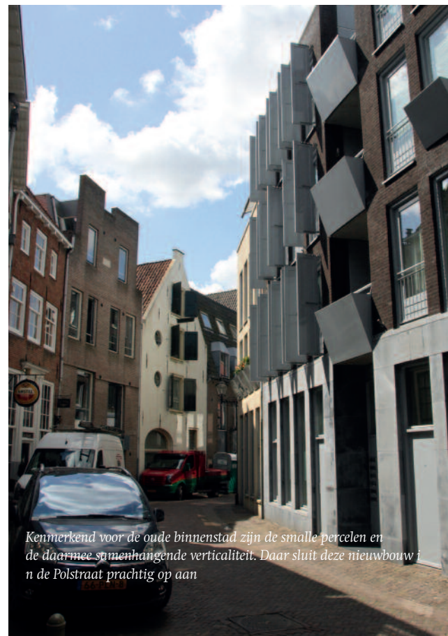
Kenmerkend voor de oude binnenstad zijn de smalle percelen en de daarmee samenhangende verticaliteit. Daar sluit deze nieuwbouw in de Polstraat prachtig op aan

De auteurs hebben Deventer ingedeeld in drie stadsdelen met ieder hun eigen identiteit: de middeleeuwse dichtbebouwde kern, de negen-