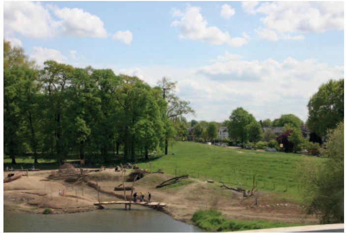
Stadsstrand met waterspeelplaats aan de groene overkant van de IJssel