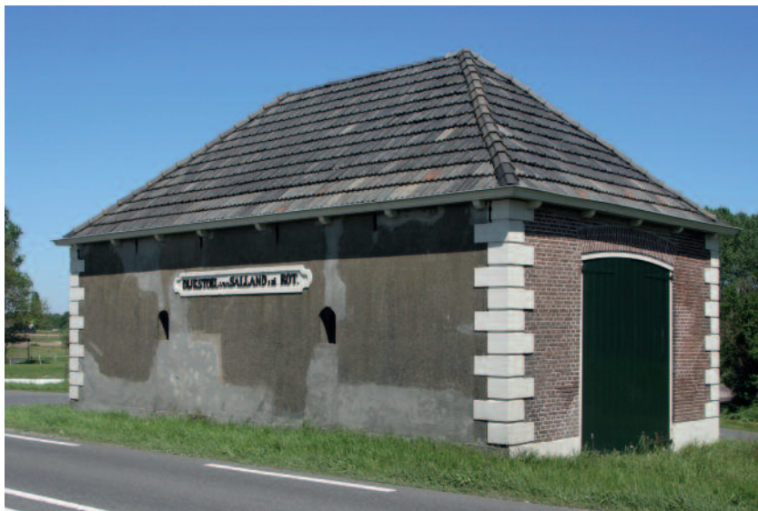
Dijkstoel aan de IJsseldijk in Diepenveen

In de eerste categorie vallen de elementen die nog een functie hebben bij het waterbeheer, een hoge cultuurhistorische waarde bezitten én goede kansen bieden voor de profilering van het waterschap. Een voorbeeld hiervan zijn een aantal dijkstoelhuisjes tussen Zwolle en Deventer, het gemaal Ankersmit in Deventer en de dijkpalen. Deze elementen zijn in beheer en onderhoud bij het waterschap en worden door het waterschap gefinancierd.