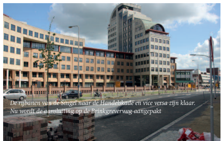
De rijbanen van de Singel naar de Handelskade en vice versa zijn klaar. Nu wordt de aansluiting op de Brinkgreverweg aangepakt

Wanneer de agenda van de Planadviesraad Monumenten en Beschermd Stadsgezicht hiertoe aanleiding geeft, woont de secretaris van de SOD zittingen bij als toehoorder.