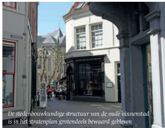
De stedenbouwkundige structuur van de oude binnenstad is in het stratenplan grotendeels bewaard gebleven

Ria de Oude-de Wolf vraagt uw aandacht voor het Stratenboek , een zeer waardevol document dat in 1998 is samengesteld in opdracht van de gemeente Deventer en dat niet in de vergetelheid mag raken.