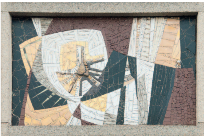
Foto onder. Henk van Baalen was aanwe- zig bij de onthulling van dit nieuwe kunstwerk door Willem Oosterwerk op de Beesten- markt. Het verwijst naar de vroegere functie van het plein