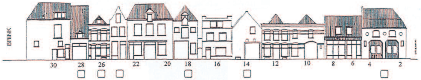
Tekening uit het Stratenboek van een gevelwand aan de Golstraat