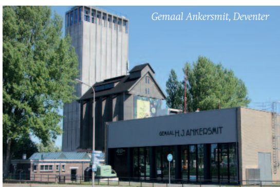
Gemaal Ankersmit, Deventer