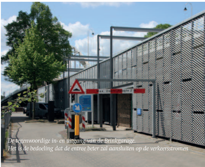
De tegenwoordige in- en uitgang van de Brinkgarage. Het is de bedoeling dat de entree beter zal aansluiten op de verkeersstromen