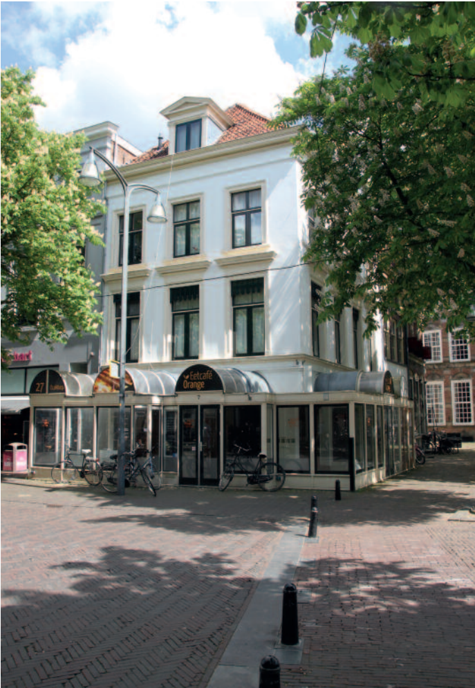
Brink 7-8 met zijn ontsierende serre

Daarnaast hebben de volgende onderwerpen hebben in 2017 aandacht gekregen van de Stichting Oud Deventer: