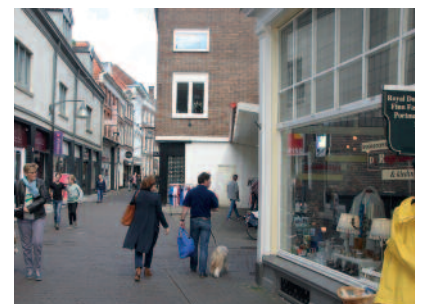
Hier is de rooilijn van de Lange Bisschopstraat op een storende manier losgelaten.