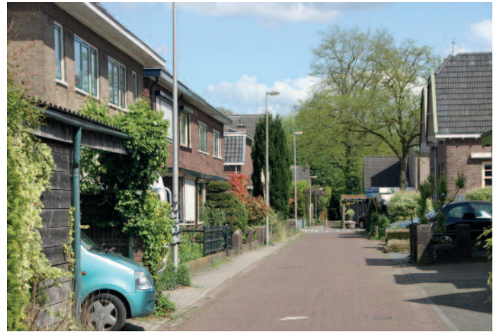
Het Groenstraatje, een sprekend voorbeeld van het groene karakter van de Hoven

functie van het beeldkwaliteitsplan louter inspirerend, omdat de plannen niet te hoeven worden getoetst. De specifieke richtlijnen voor verbouwing, nieuwbouw en openbare ruimte uit het Stratenboek zijn nooit operationeel geworden. SteenhuisMeurs vraagt zich dan ook af of de intenties van de aanwijzing tot beschermd stadsgezicht op deze wijze wel worden waargemaakt. Weliswaar zijn vanaf 2010 de bestemmingsplannen gemoderniseerd waarin het beschermd stadsgezicht is geïmplementeerd (Binnenstad, Bergkwartier, IJsselzone Binnenstad en Singelgebied Binnenstad), maar ook dan blijft er nog te veel ruimte voor de goede wil van de plannenmaker, of juist het gebrek daaraan. Daarom pleiten de onderzoekers ervoor het beeldkwaliteitsplan te actualiseren, er een vollediger en meer geïntegreerd beeld in op te nemen van de openbare ruimte en ook de naoorlogse laag te beschrijven. Ook zij delen de binnenstad in, ditmaal in tien deelgebieden, die gedeeltelijk samenvallen met die van het beeldkwaliteitsplan. En ze wijzen op het belang van specifieke criteria per deelgebied.