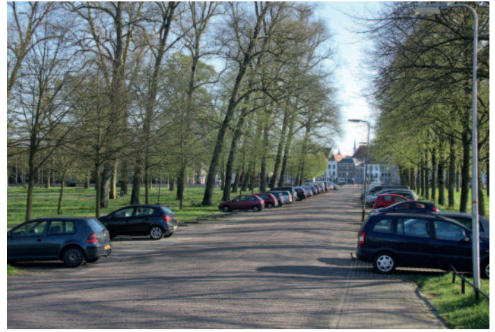
Parkeersituatie op de Worp. Zal het blik verplaatst worden naar de Melksterweide?

Het leegstaande pand Brink 7-8 krijgt een herbesteding voor horeca. De SOD dringt erop aan de ontsierende serre te slopen dan wel te vervangen door een die past in de monumentale omgeving. De gemeente staat achter deze wens van de SOD.