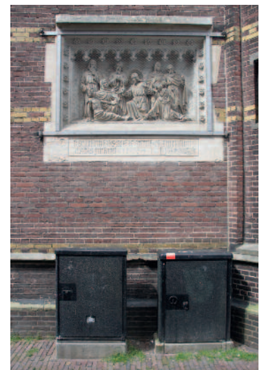
Straatmeubilair, volgens de auteurs van het Stratenboek op de verkeerde plek

directe situering. Aan weerszijden zijn de gevelwanden getekend. Vaak zijn er foto's toegevoegd. Van iedere straat is een analyse gemaakt. Beschreven wordt waar hij precies ligt en hoe het karakter zich in de loop van de tijd ontwikkeld heeft, welke functie hij nu heeft (werken, wonen, winkelen), hoe de architectuur eruitziet en hoe de openbare ruimte eruitziet (rooilijn, straatmeubilair). Met name de architectuur wordt heel gedetailleerd beschreven, bijvoorbeeld over de Assenstraat: "Als gevolg van de smalle parcellering bezitten de wanden een sterke verticaliteit. Kelders vallen in het oog vanwege de hoge borstweringen en kenmerkende diefijzers". Ook het gebruikte materiaal en de kleurstelling krijgen ruim aandacht. Bij wijze van conclusie wordt aangegeven wat de gewenste beeldkwaliteit is. Bijvoorbeeld dat in de Assenstraat de brievenbussen zo veel mogelijk inpandig moeten worden aangebracht, de antiparkeerpalen moeten verdwijnen en dat bij nieuwbouw de verticaliteit moet worden gerespecteerd. Het Stratenboek is er dus op gericht per geval nauwkeurige, specifieke aanwijzingen te kunnen geven, gebaseerd op grondig onderzoek.