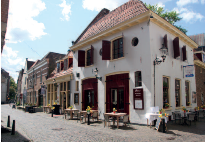
Actuele foto van dezelfde gevelwand

tiende-eeuwse schil tussen de stad en de vesting-gracht, die ruimer van opzet is, en ten slotte het weidse landschap van de IJssel en de groene Worp. Voor ieder deel gelden specifieke criteria. Groen is alleen wenselijk waar het de ruimtelijke structuur ondersteunt en dus maar mondjesmaat in het centrum.