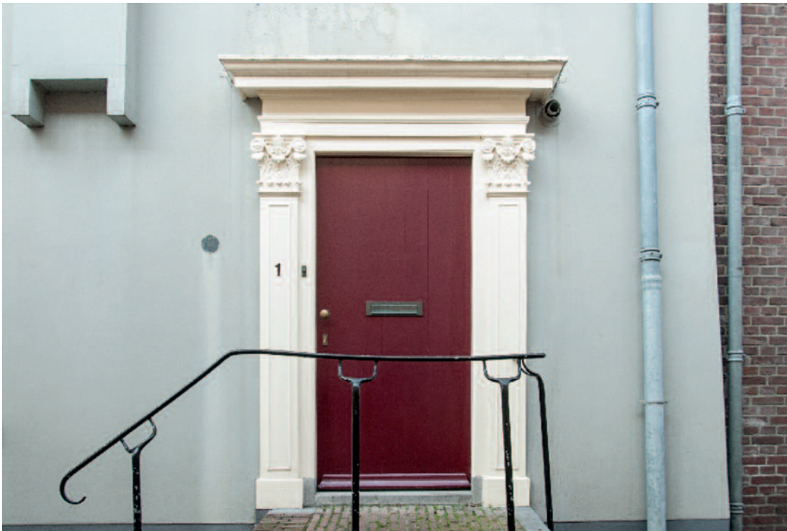
Foto links. Achter de Muren-Duimpoort 1: evenwichtig en voornamelijk is de classicistische deuromlijsting uit 1825-30 van Achter de Muren Duimpoort 1