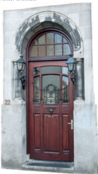
Kleine Overstraat 2: Binnen een eenvoudige, stoere omlijsting ontwierp de Deventer architect M. van Harte deze deur met lantaarns (Art Nouveau).

De schrijver heeft gekozen voor een bespreking per straat in alfabetische volgorde. Daarbij begint hij bij de binnenstad, zoals gezegd het onderwerp van de uitgave van 1998. Daar zijn nu de afdelingen 'Grachtengordel & Oude Plantsoen', 'Buiten het centrum' en 'Varia' aan toegevoegd, ook weer alfabetisch per straat opgezet. Voor een vol-