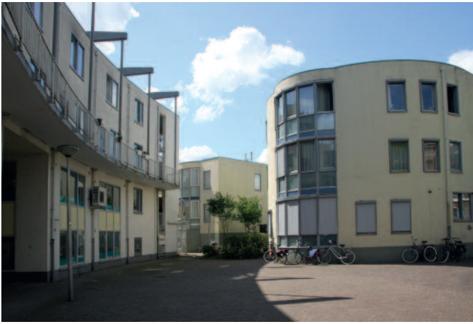
Het Sijzenbaanplein: een door de auteurs van het Stratenboek geprezen voorbeeld van stadsvernieuwing