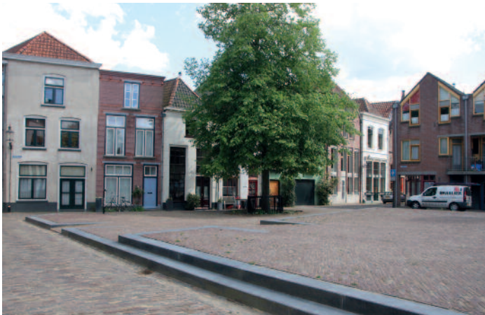
Het Muggeplein is heringericht.