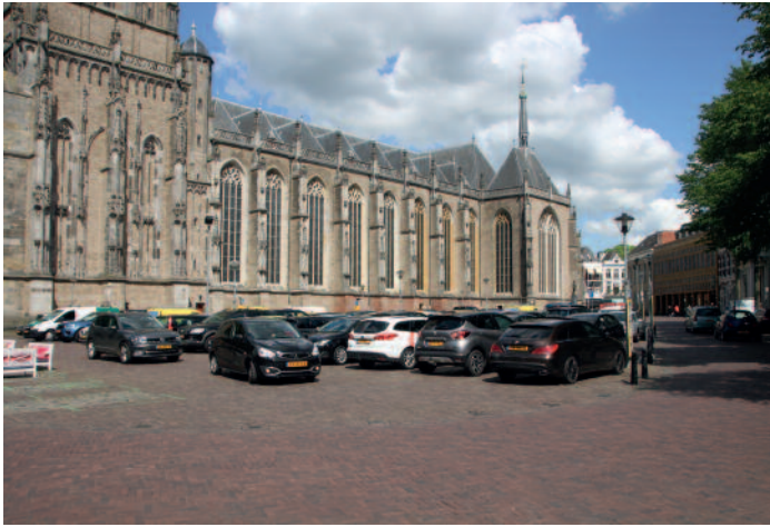
Op het Grote Kerkhof wordt nog steeds geparkeerd