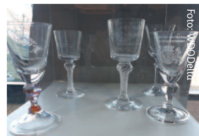
Hensbekers of waterschapsglazen, gebruikt door de bestuurders van waterschappen in hun herenkamers

Voor de categorie met elementen die geen functie (meer) hebben maar wel een hoge cultuurhistorische waarde, de tweede dus, wil het waterschap zorgen voor cofinanciering of subsidieverlening. Hiervoor is jaarlijks een beperkt bedrag beschikbaar (bij waterschap Groot Salland was dit 40.000 euro per jaar). Een voorbeeld is de IJssellinie tussen Deventer en Olst.