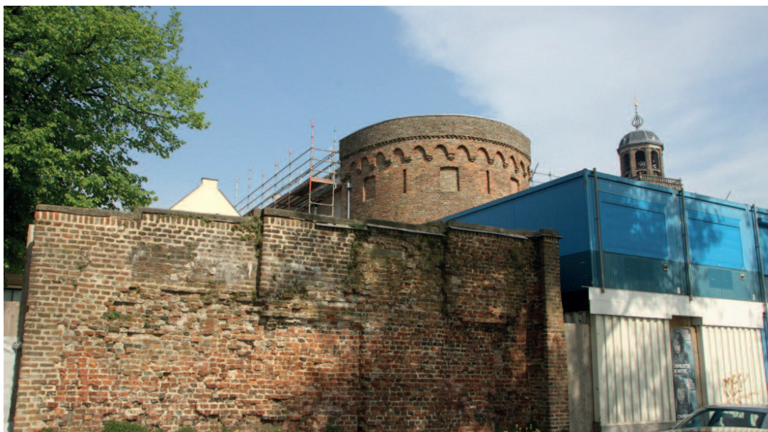
De SOD vindt dat het nieuwe theater niet hoger mag worden dan de waltoren