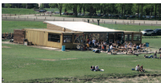
Het paviljoen bij het stadsstrand

Een klein, maar historisch waardevol relikwie van vervlogen tijden was het zogenaamde landanker. Dit anker, dat als