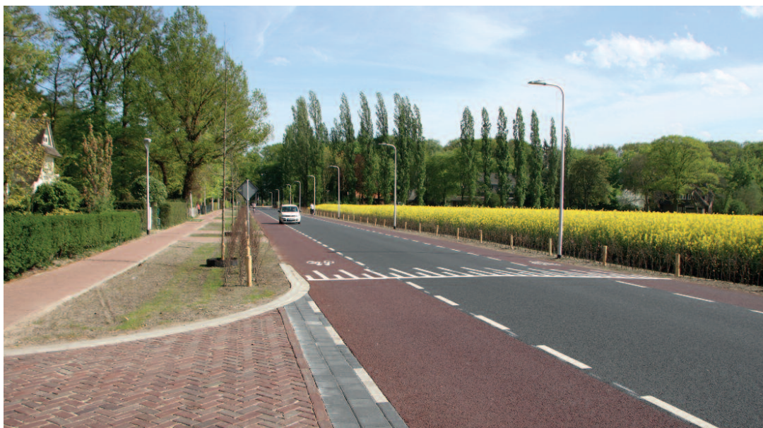
De karakteristieke middenberm is zonder gevoel voor historie weggehaald.