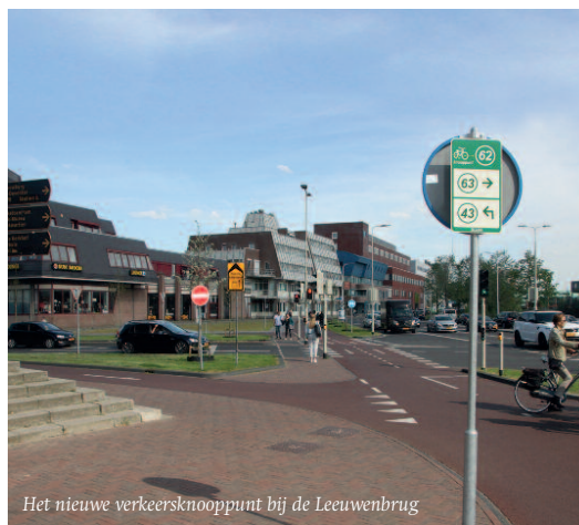
Het nieuwe verkeersknooppunt bij de Leeuwenbrug

De drukke verbinding tussen Schalkhaar en de wijk Keizerslanden wordt gereconstrueerd. Aan de ene kant ligt de Gouden Driehoek, een akker tussen de Raalterweg en Brinkgreven, aan de andere kant het beschermde dorpsgezicht Park