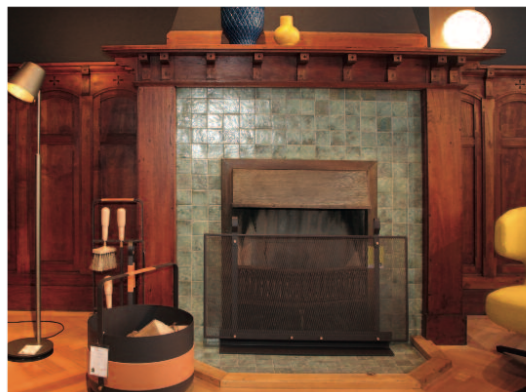
Nieuwe bestemming voor de voormalige Sallandse Bank: een interieurzaak