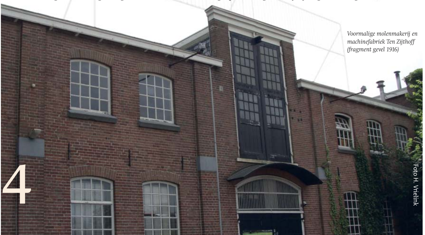
Voormalige molenmakerij en machinefabriek Ten Zijthoff (fragment gevel 1916)

De eeuwenoude haven verloor zijn functie toen in 1925 de eerste arm van de nieuwe haven werd geopend. Aangezien hij bij laag water zorgde