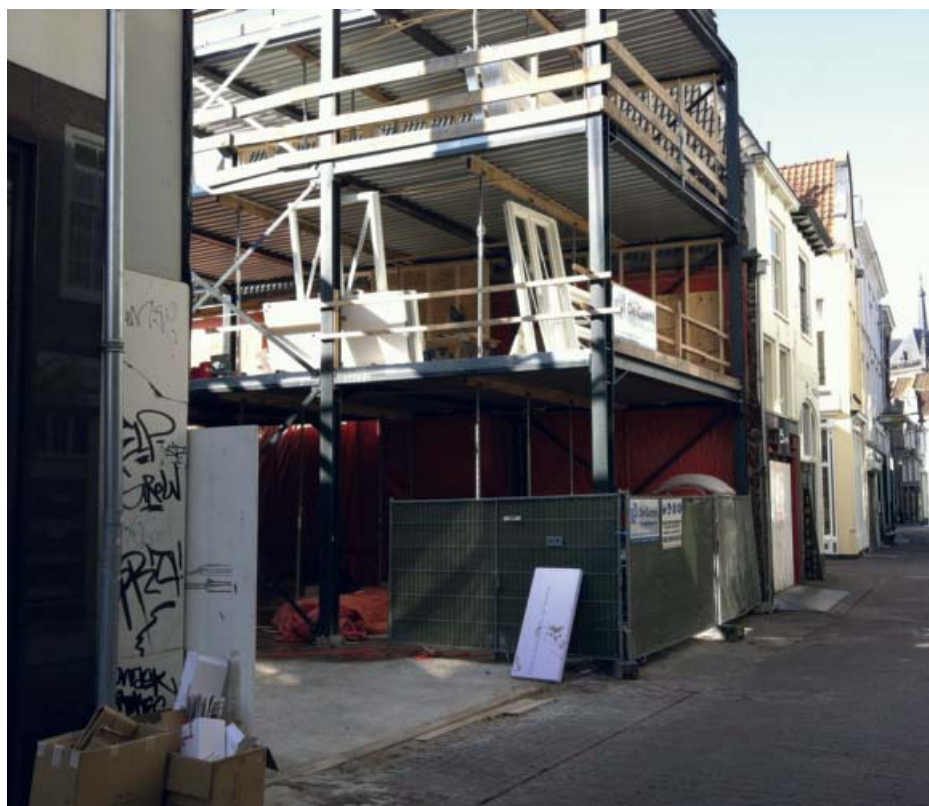
Nieuwbouw Lange Bisschopstraat na de brand in 2010

Stenvert benadrukt dat Deventer bouwhistorisch gezien een grote rijkdom kent, maar desondanks achterloopt bij steden die in dat opzicht veel minder bedeed zijn. Een stad als 's-Hertogenbosch bijvoorbeeld heeft al zo'n waardekaart. De gemeente zou ook een bouwhistoricus behoren aan te stellen.