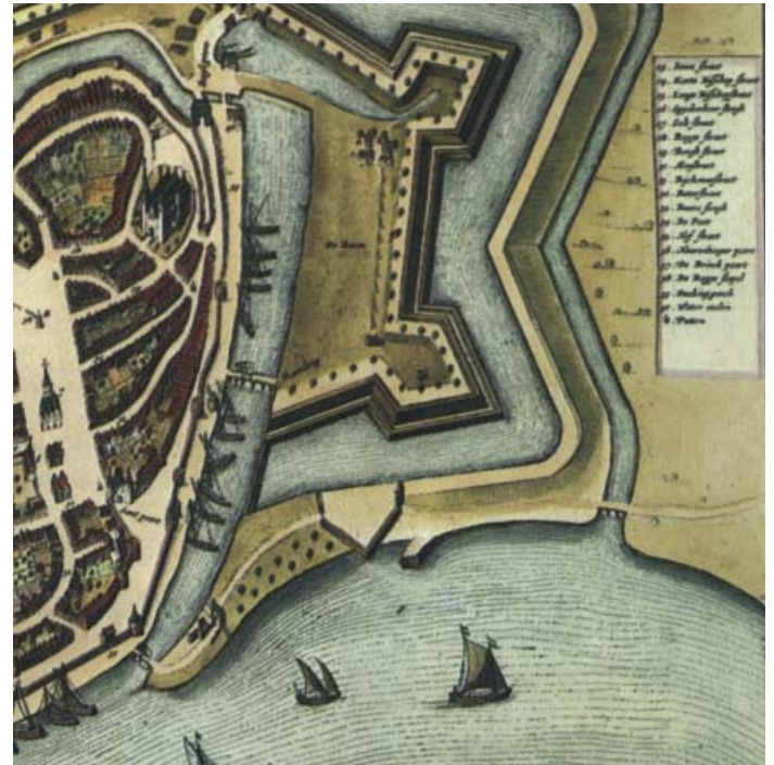
Blaeu, kaart van Deventer, 1652: fragment met Pothoofd en Raambuurt

Na de opheffing van de vesting Deventer in 1874 konden de wallen geslecht worden. De Raambuurt, waar de ijzergieterij van Nering Bögel en de gasfabriek al gevestigd waren, werd bestemd