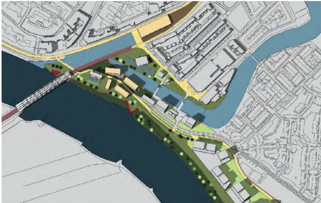
Schets van Jo Coenen voor de ontwikkeling van het Sluiskwartier, 2011

In 2007 komt de Stichting Oude Haven Deventer met een uitgewerkt plan, dat ook weer uitgaat van een verkorte aanlanding van de Wilhelminabrug ter hoogte van de Sluisstraat. De buitengracht wordt via een smal kanaal met de haven verbonden, het Sluiskwartier wordt bedacht met een dichte bebouwing. In 2008 volgt een tweede burgerinitiatief, het plan Pothoofd-park van de SIED. Voorop staat het behoud van industrieel erfgoed. Een belangrijk verschil met het plan van de Stichting Stadshaven Deventer is de keuze voor een open gebied met meer water en groen. De Wilhelminabrug wordt gewaar-