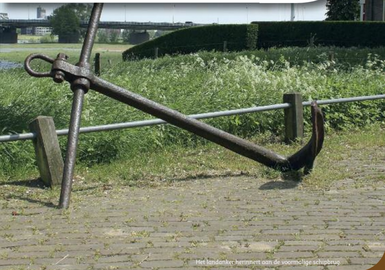
Het landanker herinnert aan de voormalige schipbrug.

PAG. 2 Van de redactie PAG. 2 Van de voorzitter PAG. 3 De schipbrug van Deventer PAG. 6 Verslag donateurs-avond op dinsdag 9 april 2013 PAG. 8 Plannen voor de stationsomgeving PAG. 9 Schimmelpenninck: een Deventenaar van nationale betekenis PAG. 12 Jaarverslag over 2012 van de Stichting Oud Deventer (SOD)