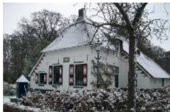
Boerderij 'Pinel' met de gerenoveerde pomp op het landgoed Bringreven

De pilotstudy van het Tuindorp, een initiatief van de SIED, was op een laag pitje komen te staan, maar is aan het eind van 2011 voorzichtig weer opgepakt. Het gebied wordt begrensd door de Hoge Hondstraat, Ceintuurbaan, Karel de Grotelaan en de Margijnenenk. Een nieuwe werkgroep, waarin een vertegenwoordiger van de SOD en de gemeente zijn vertegenwoordigd, beziet met hulp van een architect de mogelijkheden om vooral beleidsmakers, planologen en architecten de te doordringen van de waarde van de Wederopbouwarchitectuur.