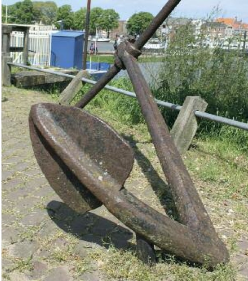
Herinnering aan het landanker van de schipbrug

Het landhoofd is de stille getuige van een belangrijk element uit de Deventer geschiedenis: van alle interlokale en internationale verkeer dat sinds 1600 via de schipbrug over de rivier en door Deventer trok. Het verdient daarom een officiële status als monument.