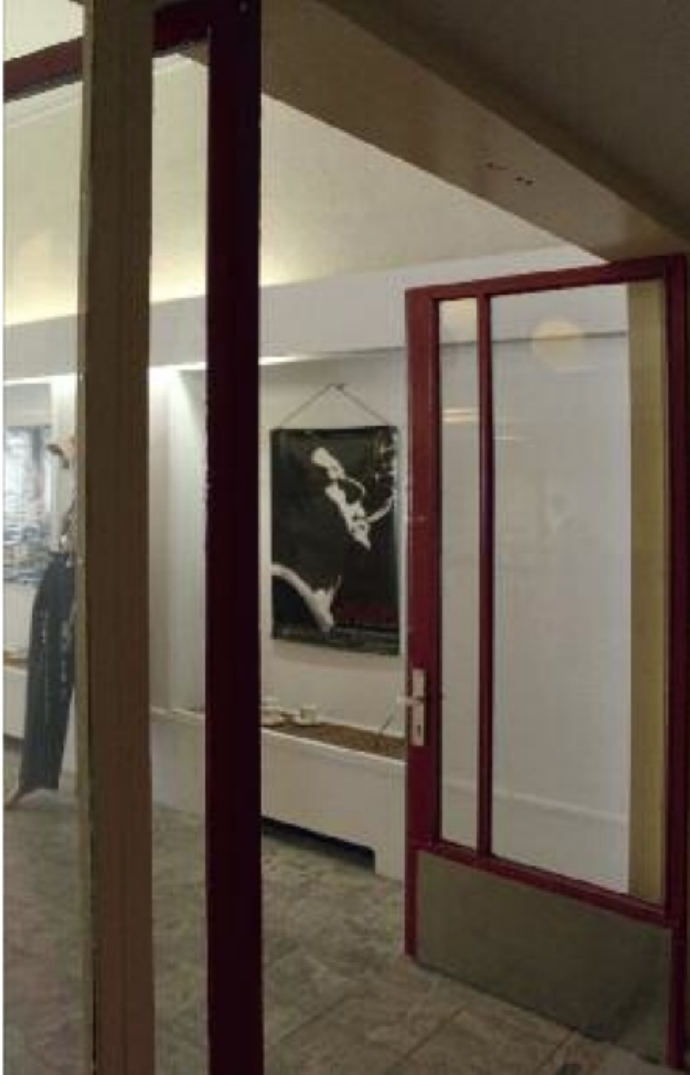
Entree van de voormalige schouwburg aan het Grote Kerkhof: de bijzondere maatvoering is nu voor Deventer verloren