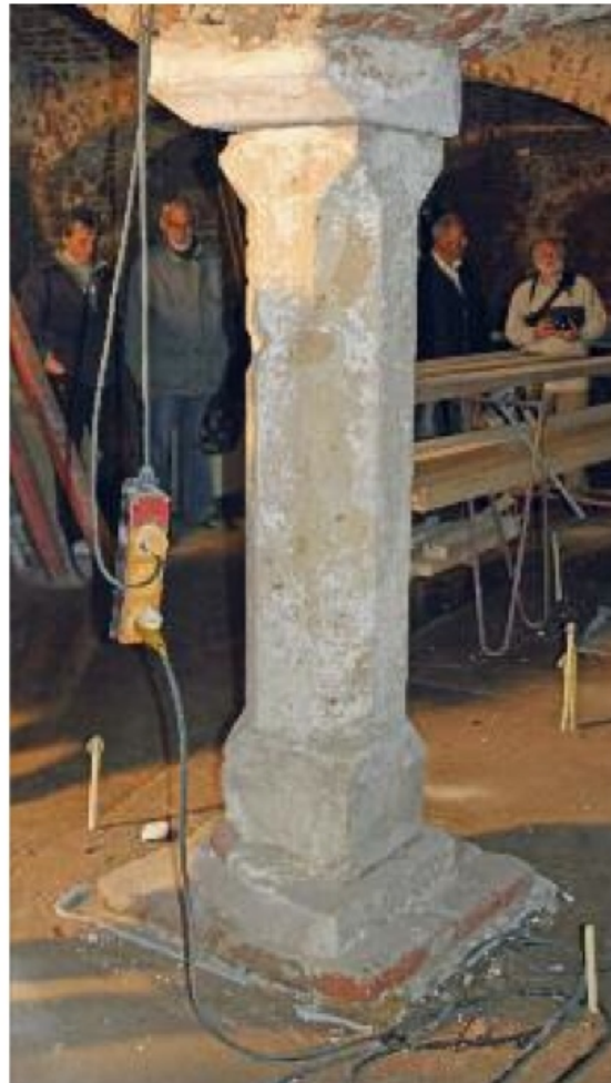
Vorig jaar is de restauratie van de kelder onder de kapel van het voormalige Heer Florenshuis (Lamme van Dieseplein) voltooid

ning van enkele gebouwen in samenhang met de nieuwbouw van het stadskantoor, heeft er verder op gewezen dat de vereiste procedures voor de bouw correct dienen te worden gevolgd en heeft ook ingesproken op de Politieke Markt. Helaas heeft de stichting moeten accepteren dat enkele waardevolle monumenten toch gesloopt zullen worden, de voor-gevel en de achterliggende foyer van de oude schouwburg, de gevel van het schooltje aan de Polstraat, en het gehele stadskantoor aan het Burseplein. Alle drie de gebouwen zijn van cultuurhistorisch belang voor Deventer, zoals beschreven is in ons jaarverslag van 2011.