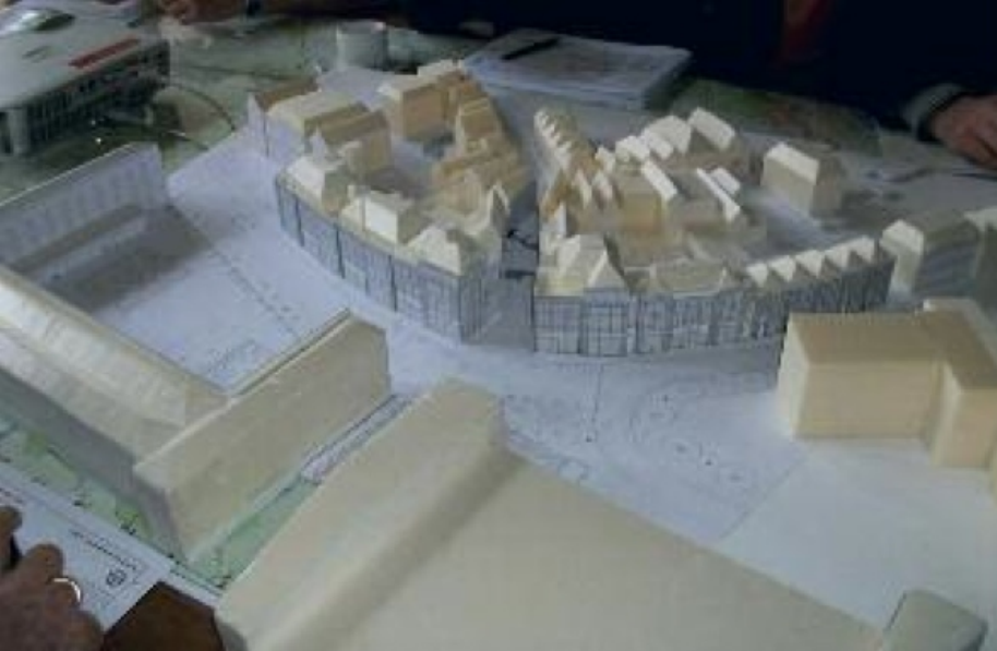
Maquette van de plannen voor de Boreel en de Houtmarkt