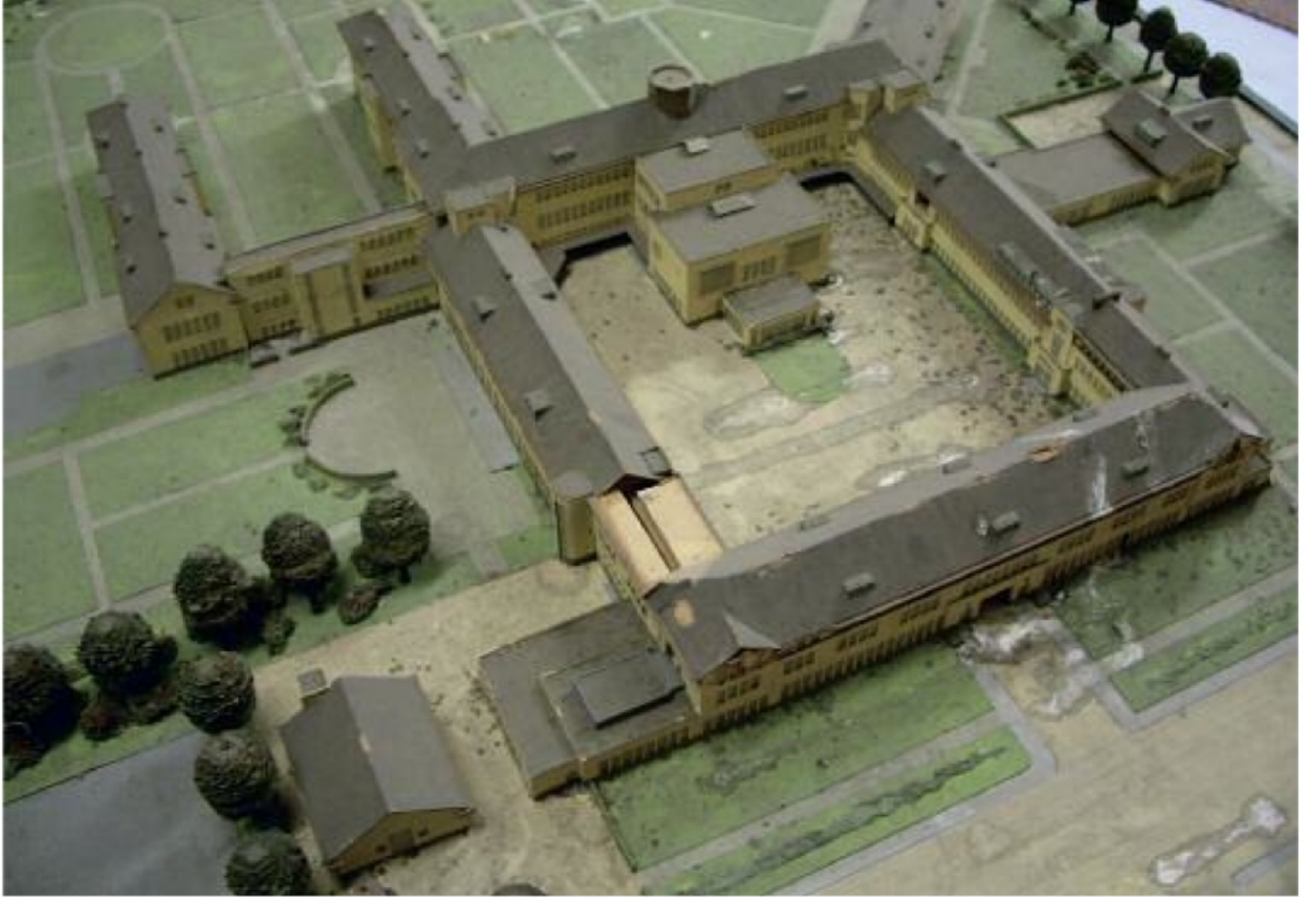
Maquette van het Geertruiden Ziekenhuis