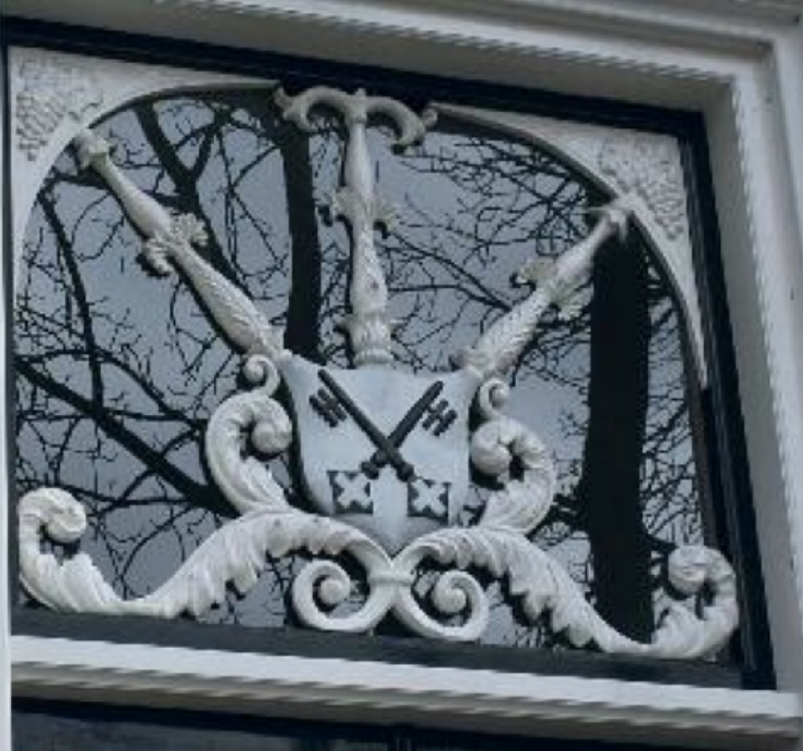
Het familiewapen van de Schimmelpennincks (Deventer, Brink 32)