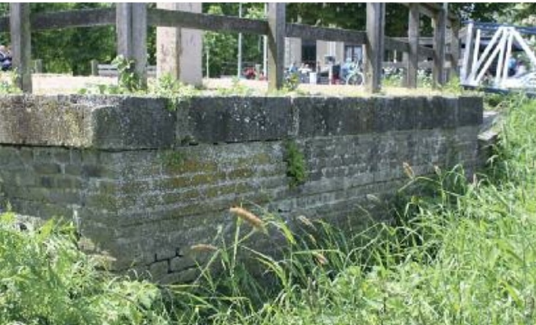
Restant van het landhoofd van de schipbrug aan de Worpzijde

durfde het stadsbestuur weer aan een vaste oeververbinding te beginnen. Ditmaal werd het een schipbrug. Vanaf de Welle was er eerst een ophaalbrug, dan een drijvend, uitdraaibaar gedeelte in de rivier voor de doorvaart van houtvloten en ijsgang, dan de eigenlijke schipbrug en aan de overzijde boven land een – steigerachtige – aanbrug, die eindigde ter hoogte van het IJsselhotel bij het gemetselde landhoofd. Deze constructie hield het uit tot in de vorige eeuw, uiteraard wel dankzij de nodige reparaties. Niet altijd zorgde het stadsbestuur goed voor deze enige westelijke toegang tot de stad. Zo was in 1817 sprake van ernstige verwaarlozing, waardoor een van de schepen van de brug zinkte. De raad overwoog een stadsarchitect aan te stellen om toezicht te houden op de brug en andere vitale delen van de stad, maar voorlopig werd die taak toevertrouwd aan twee burgers. Pas in 1820 werd het gezonken schip vervangen.