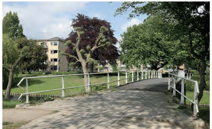
Het groen en het water horen bij het monument aan de P.C. Hoofflaan