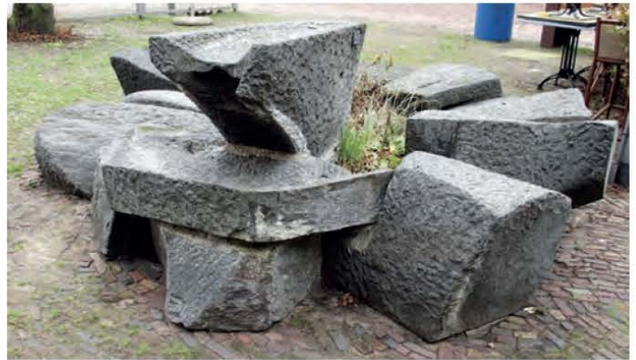
De Fontein van Bürgi

Deze vijf portiekflats, in het gras bij een vijver, zijn een mooi voorbeeld van woningbouw uit de naoorlogse periode. Ze zijn gelegen in de wijk Zandweerd Noord. De flats zijn eigendom van Woonbedrijf Ieder1, dat plannen heeft voor sloop en daarna nieuwbouw. De gebouwen en de ruimte eromheen zijn een mooi ensemble: cultuurhistorisch, architectuurhistorisch en stedenbouwkundig van belang. Ook Heemschut is die mening toegedaan. De Stichting Oud Deventer heeft dan ook een verzoek ingediend om de flats en de bijbehorende groenvoorziening aan te wijzen als gemeentelijk monument.