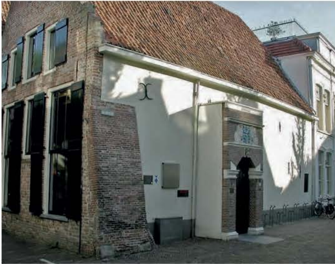
Zorgen over de Athenaeumbibliotheek

Collectie Overijssel betreft ook de huisvesting van de Athenaeumbibliotheek, op dit moment in Klooster 12. Wij hebben aan de gemeente onze zorgen kenbaar gemaakt over het verdwijnen van Deventer archiefstukken uit onze stad.